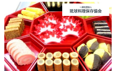
一般社団法人 琉球料理保存協会