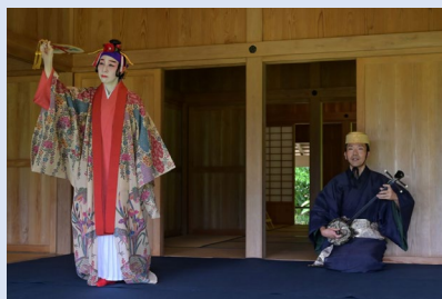
○世界遺産 国指定特別名勝「識名園」での奉納