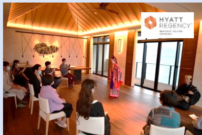
○ハイアットリージェンシー瀬良垣アイランド 沖縄様：14年連続三ツ星の神田シェフとコラボ