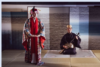
○「首里城で感じるホンモノのモノ」@首里城（2021年）