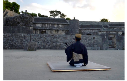
首里城破損瓦・琉球びんがたデザインと最新建築技術の融合