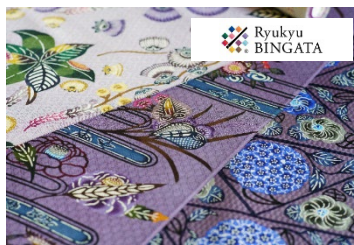
一般社団法人 琉球びんがた普及伝承コンソーシアム