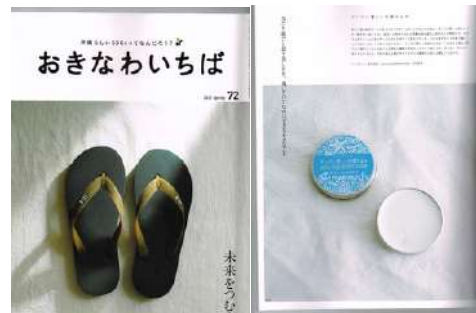
OTVイット!~アイランドスコープ~