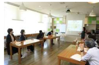
健康経営セミナー &ワークショップ