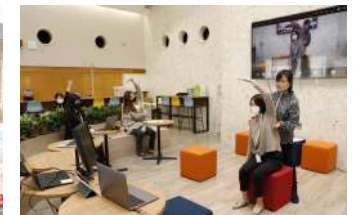
オンライン フィットネス