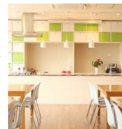
(一社)トータルウェルネスプロジェクトオキナワ

統括プロデューサー。2008年IT企業を3人で設立。2015年トータルウェルネスプロジェクトオキナワを現代表と設立。社会の課題解決・公民連携・地域発の事業を読谷で始動。学び・対話・体感から参加者の実践へ導く研修を行います。