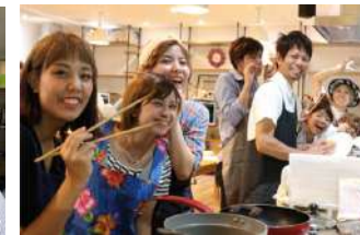
チームビルディング クッキング&ランチ