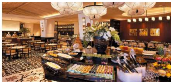
ビュッフェダイニング名城