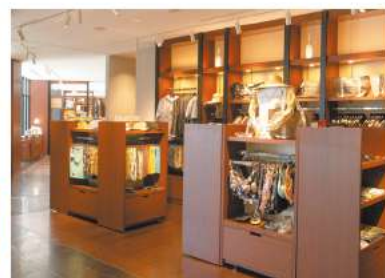
Hotel Shops THE MARKET / THE SELECTION