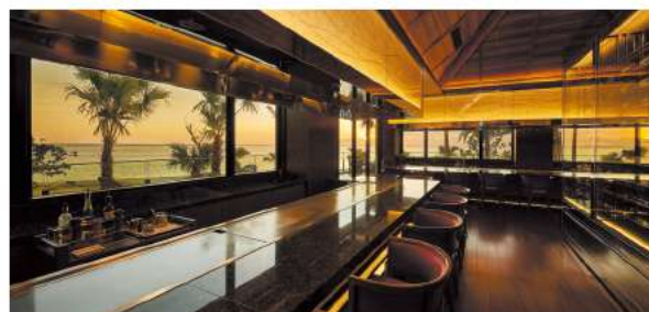
鉄板ダイニング 虹

日本を代表する好漁場の金沢をはじめ、全国各地から産地直送で届く海の幸を、斬新なジャパニーズフュージョンでご提供いたします。「海のうねり」を表現した琉球ガラスに彩られた風情ある空間も印象的です。