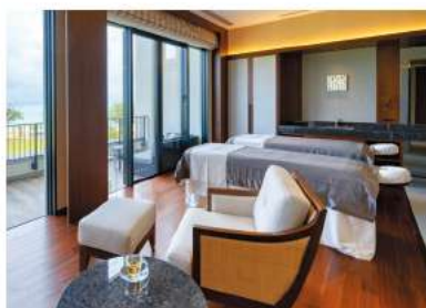
SPA ayualam スパ アユアラン