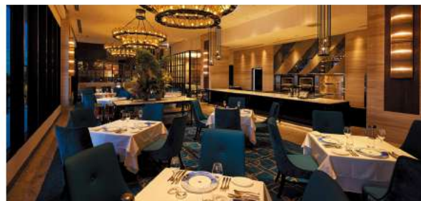
ファインダイニングミラノ

開放感あふれる空間で、朝食とランチをお楽しみいただけるビュッフェダイニング。各国の味を味わえるワールドビュッフェでは、約150種類以上の本格メニューが並びます。出来立ての料理をライブ感満載にご提供するオープンキッチンも必見です。