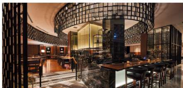
ジャパニーズフュージョンかなざわ

夕日が沈みゆくマジックアワーの海を眺めながらディナーを味わうファインダイニング。音や香りの演出にもこだわった空間で、イタリア料理を中心に既成概念にとられないボーダーレスな逸品をお楽しみいただけます。