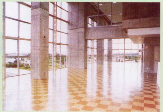
ラウンジ(手前) リハーサル室(奥)