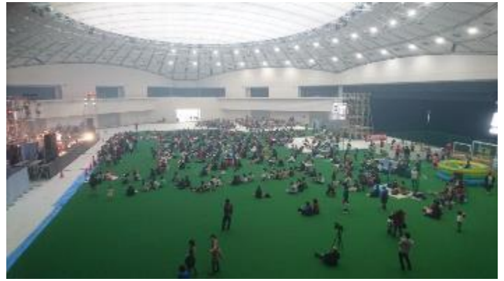
サイドに特設ステージを設置