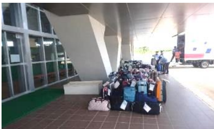
荷物を直接ドームに郵送