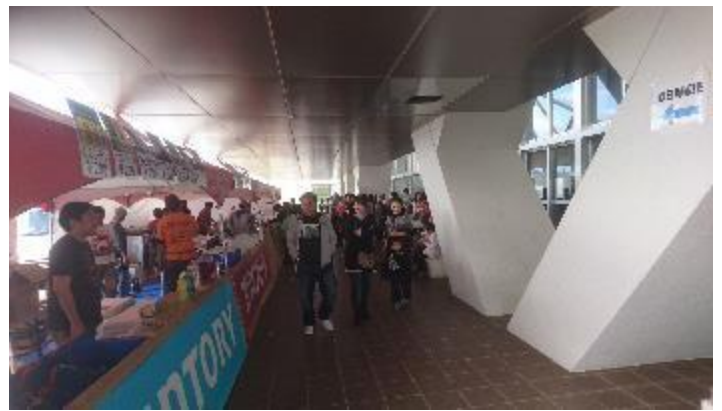
キャノピー下に屋台が出店