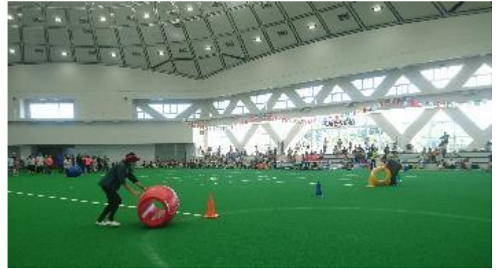
保護者参加の樽転がし