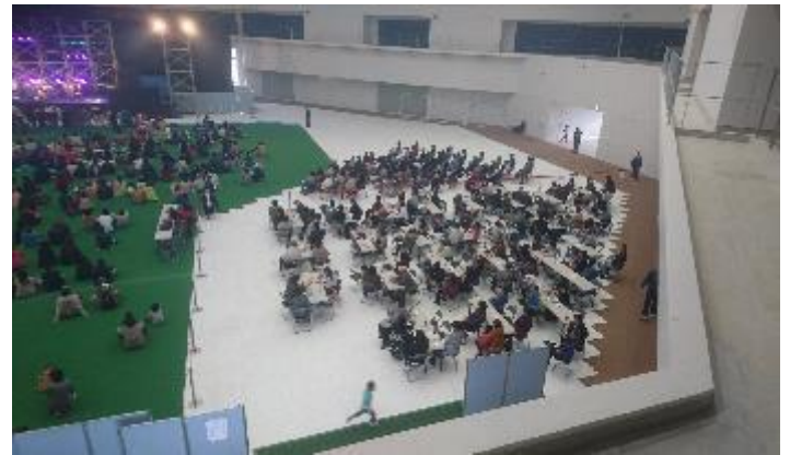
ポーターパネルを使った飲食ブース