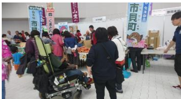
電動車いすで来場