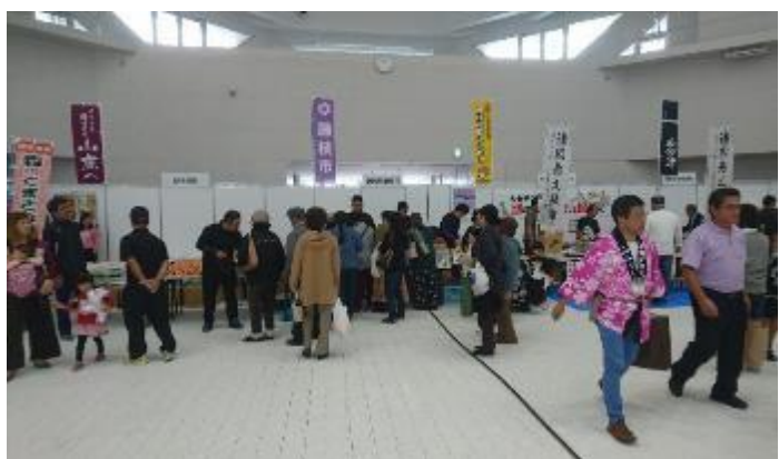
姉妹都市の特産品も販売