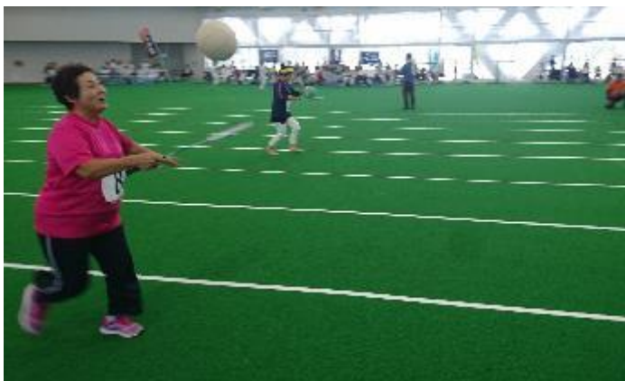
高齢者運動会ボール運びリレー