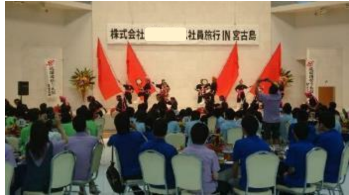
地元エイサー団体による演武