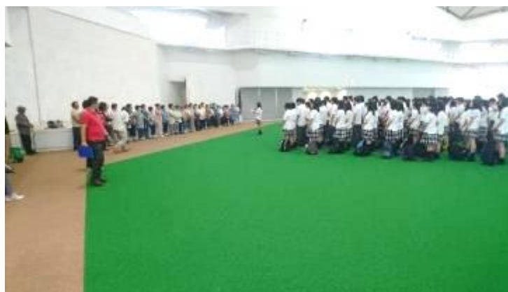
旅行前の注意事項なども