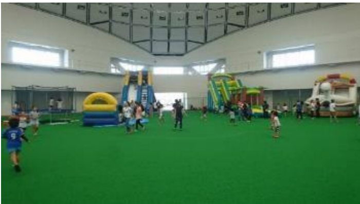
アリーナ内大型遊具