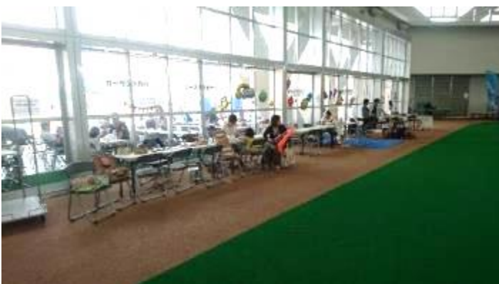
アクセサリ作りなどのブース