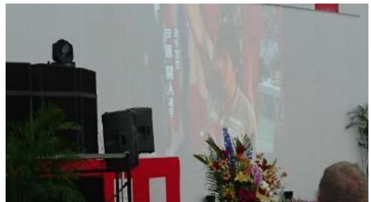
大会ダイジェストを放映