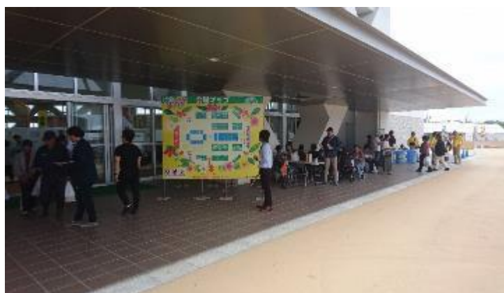
キャノピー下の休憩スペース