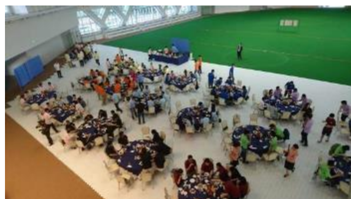
ポーターパネル上でパーティー