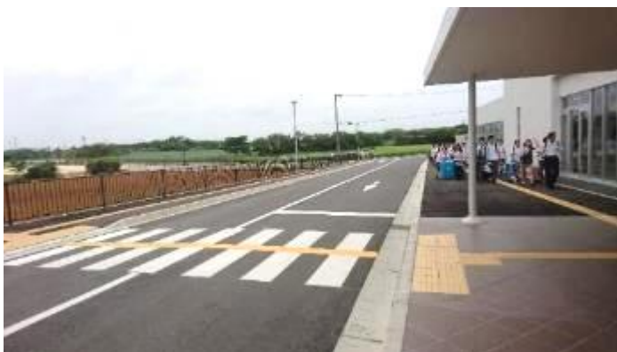
空港から徒歩で移動