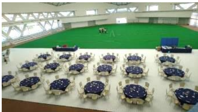
前方にパーティー会場、後方は人工芝