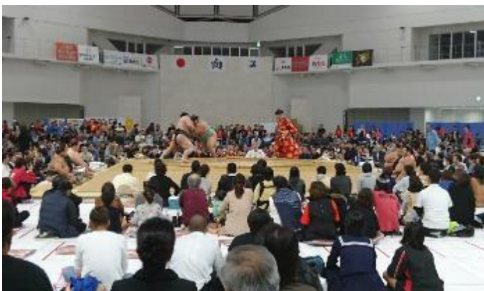
迫力のある取組を間近で見られる