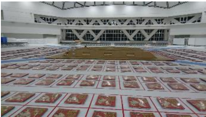
土俵周辺に座布団、後方に椅子席を設置