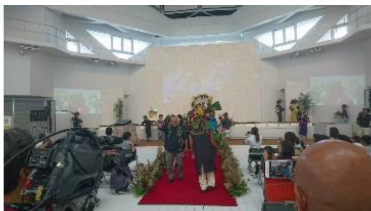
舞台を利用したファッションショー