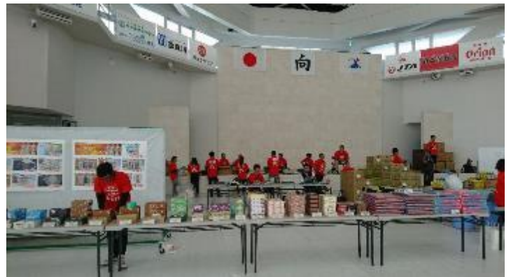
物販ブース、2階通路に協賛広告