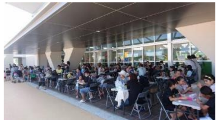
キャノピー下飲食ブース