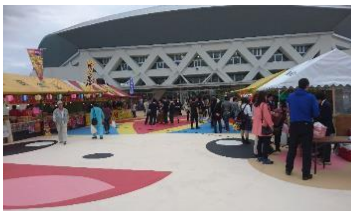
みーや広場の屋台