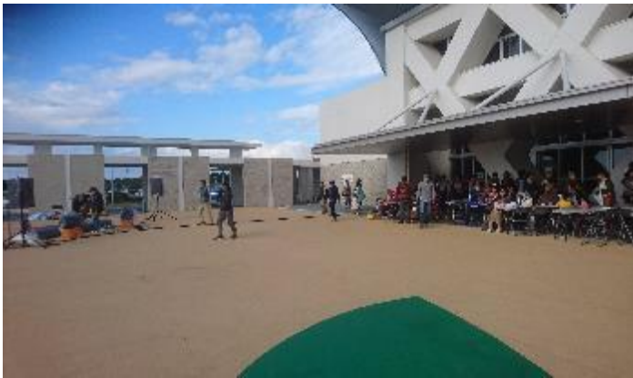
みやや広場にも特設ステージを設置