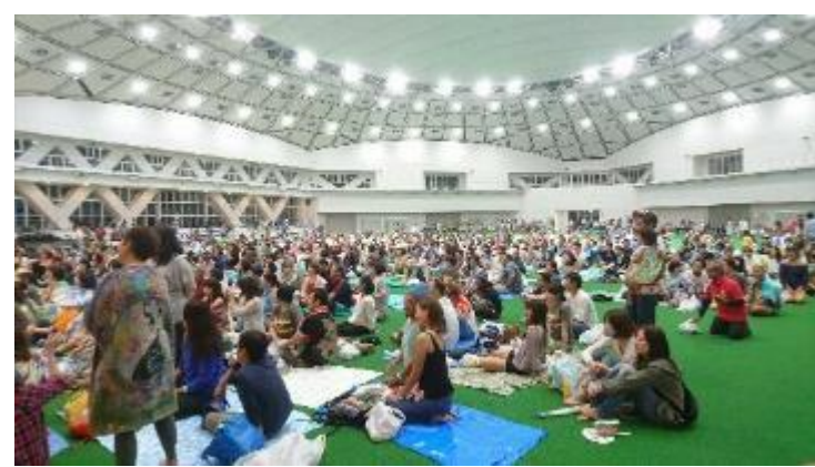
ライブを楽しむ観客