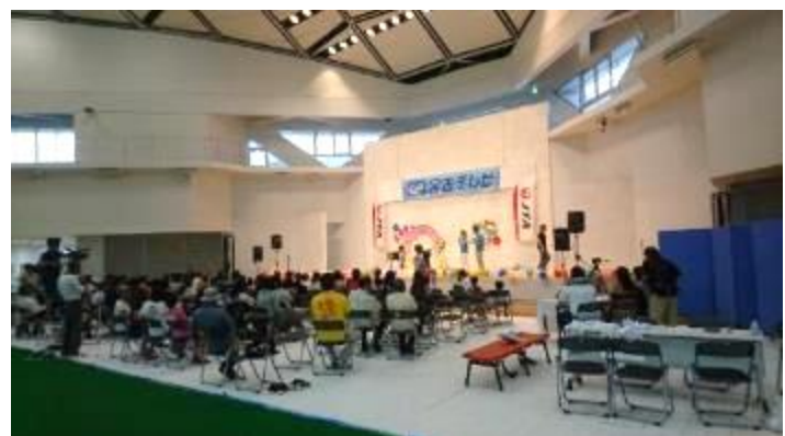
子どものど自慢大会