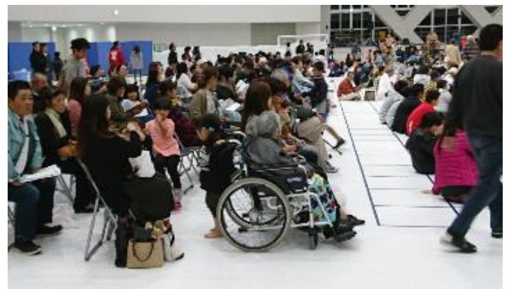
車いすでの鑑賞も容易