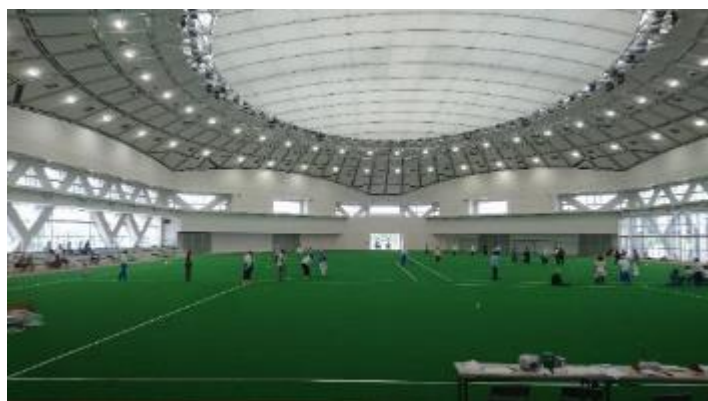
ドーム内部 (人工芝)

※普段の利用は人口芝になります。 ※イベントの際は必要に応じて、芝の上にポーターパネル、もしくは、スポーツコートを設置します。 ※通常の式典等では固定ステージを利用。 (幅約12m、奥行約5m) ※天候に左右されずに各種イベントを開催することが出来ます。