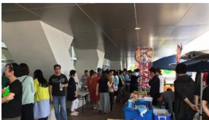
キャノピー下飲食ブース