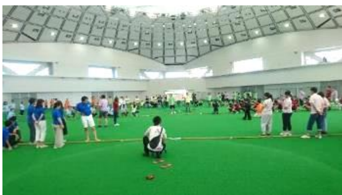
人工芝上で綱引き大会