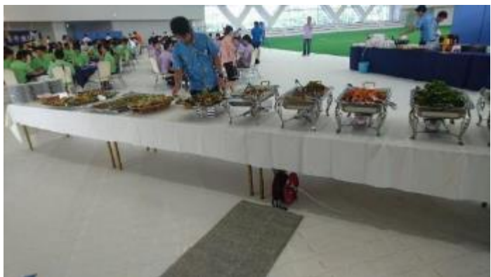
ホテルによるケータリング