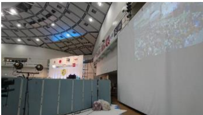
ドローン撮影の映像を放映