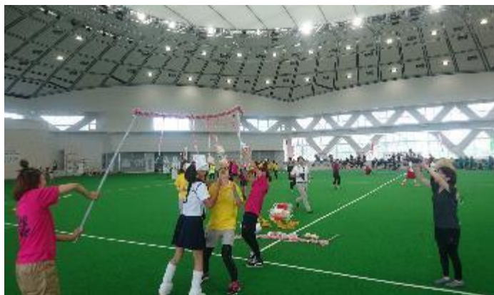
女子運動会パン食い競争