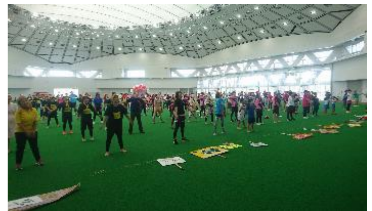
女子運動会みんなで準備体操