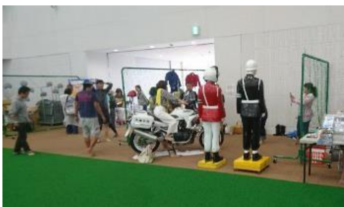
記念撮影コーナー（宮古島まもる君）