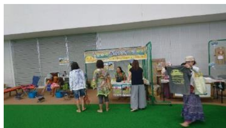
マッサージコーナー