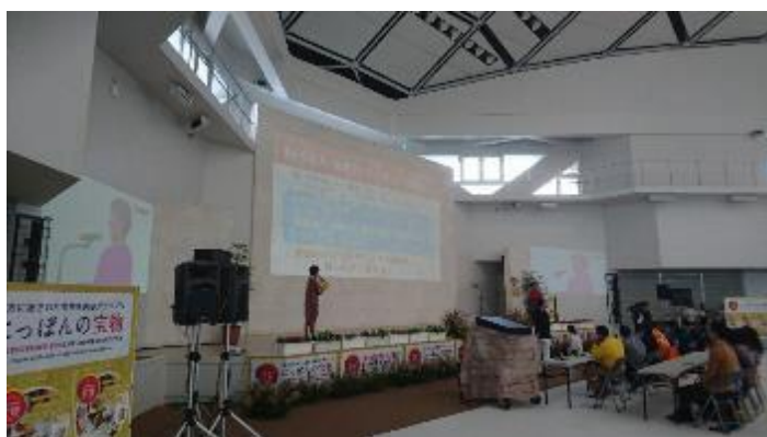
プロジェクターを使用したプレゼン