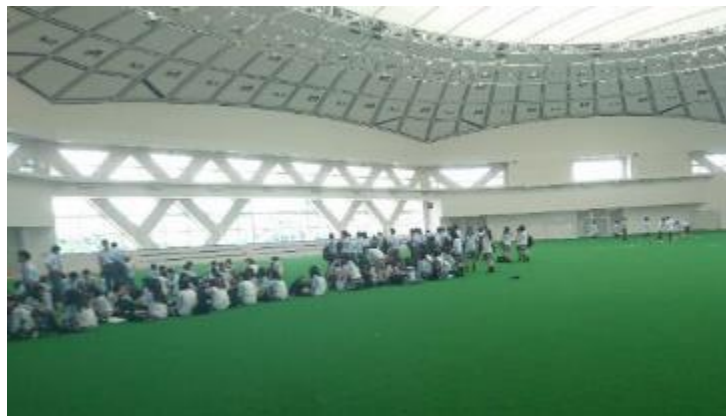
他の観光客を気にすることなく式典を行える