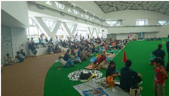
屋内なのでテントの設置が必要ない