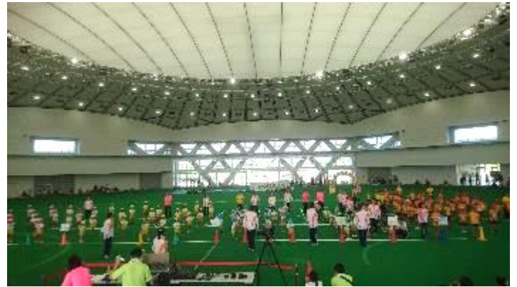
雨を気にせず保育園の運動会