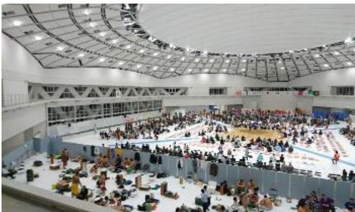
パーティションで支度部屋