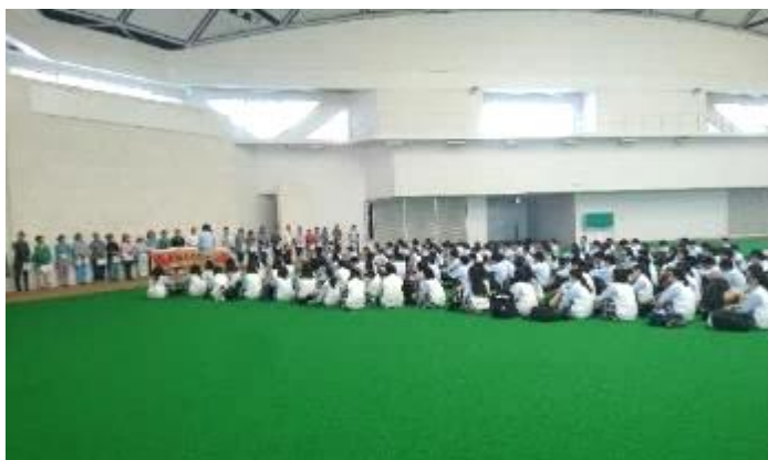
人数が多くても対応可能