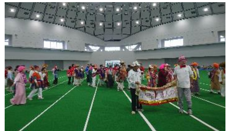
老人クラブの踊り