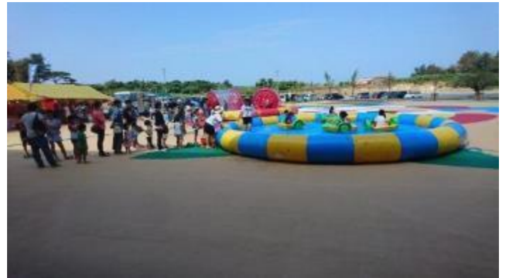
みーや広場プール