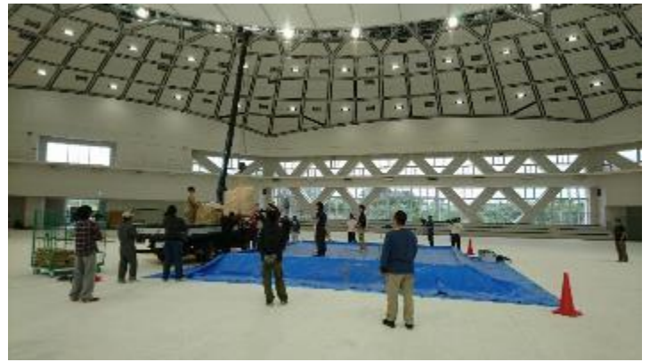
ドーム中央に土俵を設置