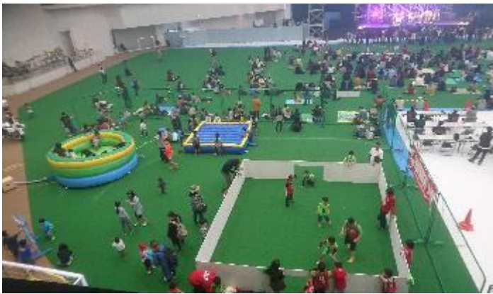
ドームの備品によるキッズコーナー