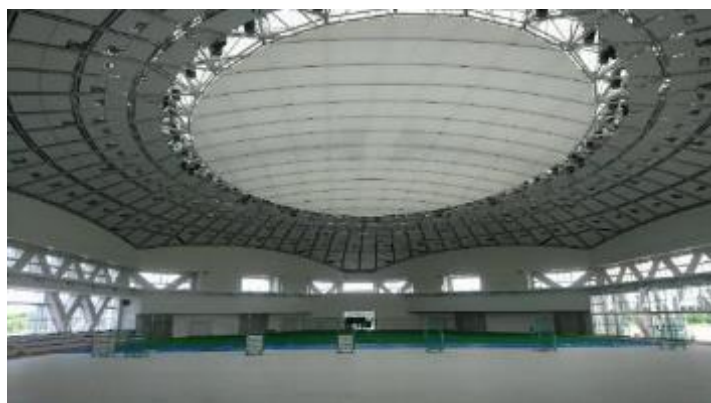
ドーム内部 (ポーターパネル設置)