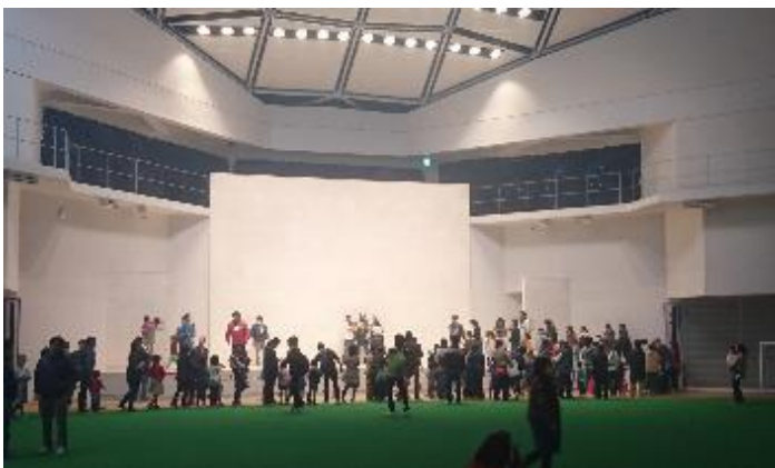
常設ステージでは琉神マブヤーの撮影会