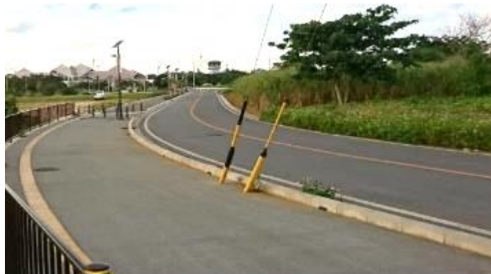
空港が見える距離