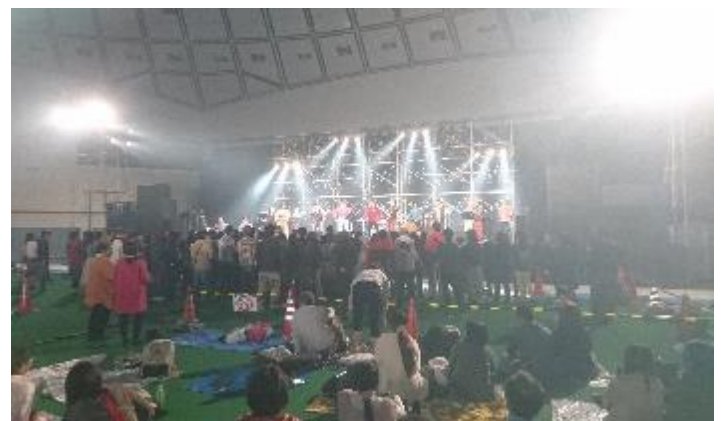
舞台前はスタンディングエリア、後方ではレジャーシートを敷いてのんびり鑑賞する人も